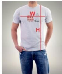
Adult T-shirt Sizes